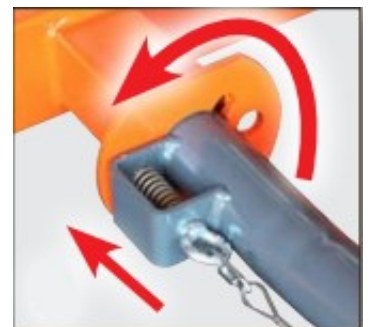
Dissel met beveiligde vergrendeling.